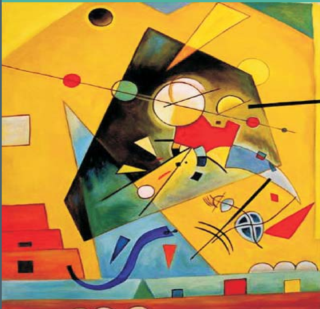
“Harmony in Blue” by Wassily Kandinsky [1886-1944]