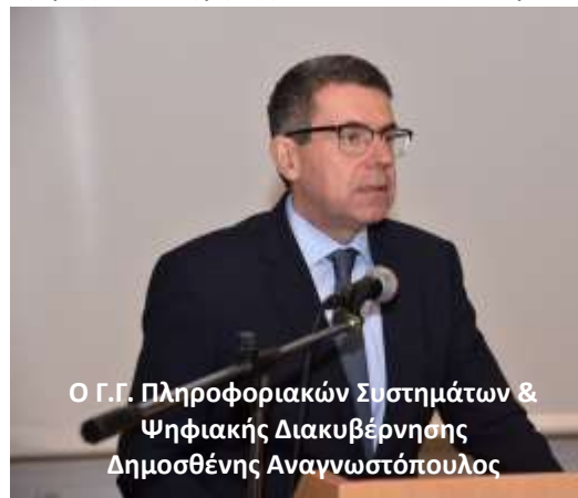
Ο Γ.Γ. Πληροφοριακών Συστημάτων & Ψηφιακής Διακυβέρνησης Δημοσθένης Αναγνωστόπουλος

Θα πρέπει να επισημάνουμε ότι ο πρώτος Πανελλήνιος διαγωνισμός διοργανώθηκε από την Ελληνική Μαθηματική Εταιρεία το 1934 και είναι από τις σημαντικότερες δραστηριότητες της ΕΜΕ, που μεταξύ άλλων συμβάλλει στην ανάπτυξη των πιο δημιουργικών ικανοτήτων και στην καλλιέργεια της ευγενικής άμιλλας μεταξύ των μαθητών. Η συμμετοχή κατά χιλιάδες των μαθητών μας αποδεικνύει το υψηλό τους ενδιαφέρον για την επιστήμη των Μαθηματικών. Ενδεικτικά την τρέχουσα σχολική χρονιά, στον 86 ο Πανελλήνιο Μαθητικό Διαγωνισμό στα Μαθηματικά «Ο ΘΑΛΗΣ», που αποτελεί